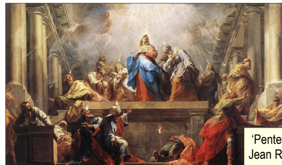
'Pentecost' by Jean Restout II

La Confirmación, entonces, es una parte integral del designio amoroso de Dios para la salvación. A través de ella, nuestro lugar en la única, Sagrada Familia de Dios, es ratificado, fortalecido, confirmado. Como un sacramento, es un signo visible de la nueva alianza, que nos arraiga más profundamente en la filiación divina, nos une más firmemente a Cristo y hace que nuestro vínculo con la Iglesia sea más perfecto. (Catecismo, 1303).